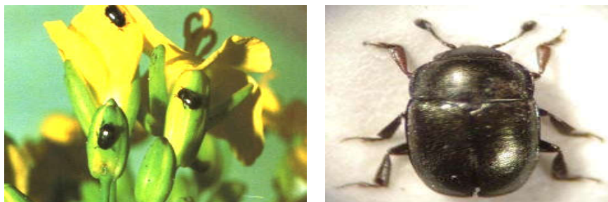
شکل ۱ - حشرات کامل سوسک گرده خوار Meligethes aeneus

جلوئی آن کم عرض می باشد. قسمت روی بدن (سر و بالپوش ها) منقوط می باشد. پاها سیاه رنگ و ران وسطی در قسمت داخلی بدون دندان؛ شاخک گریزی شکل، کشیده و ۱۱ مفصلی است (شکل ۱).