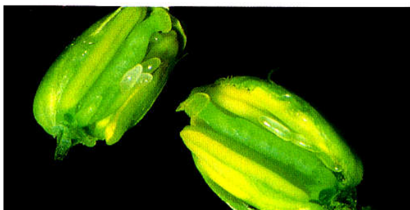
شکل ۲- تخم های سوسک گرده خوار که در داخل غنچه ها گذاشته شده

تخم: بیضی کشیده و در طرفین پخ (مسطح) می باشد و ظاهری شیشه ای به رنگ سفید شیری یا کرم دارند و طول آن ها در حدود ۰/۸-۰/۶ میلی متر می باشد (شکل ۲).