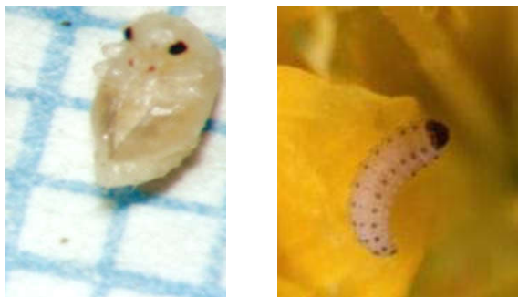
شکل ۳- لارو (سمت راست) و شفیره (سمت چپ) سوسک گرده خوار کلزا

شفیره: شبیه تخم ها بوده و رنگ آن شیری تا سفید زرد رنگ است. طول آن در حدود ۲ میلی متر است (شکل ۳).